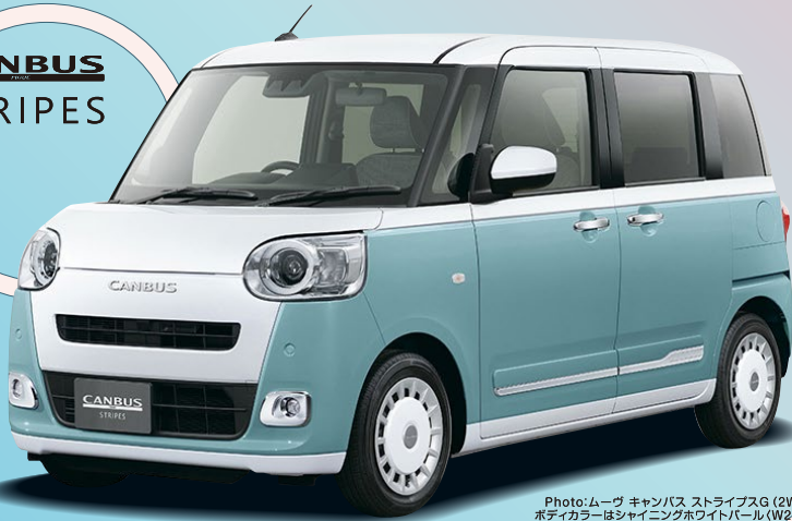
Photo:ムーヴ キャンバス ストライプスG (2WD) ボディカラーはシャイニングホワイトパール(W26)× レイクルームメタリック(B87) [XKG]

ムーヴ キャンバス ストライプスG 車両本体価格(税込) (2WD/CVT/660cc) 1,672,000円